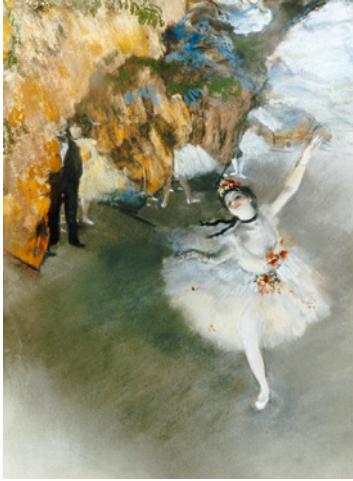
Bailarina en el escenario (Edgar Degas, 1880).