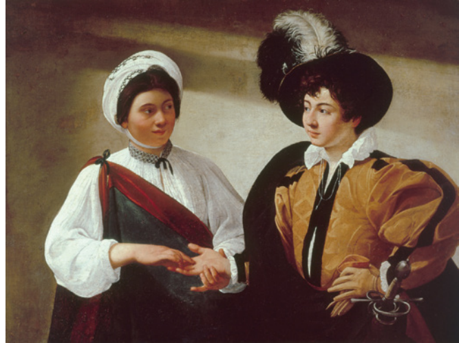
La Buena Ventura (Caravaggio, 1595-1598).